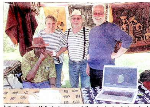
À l'instar d'Ouan Mali, plusieurs associations locales tenaient un stand.