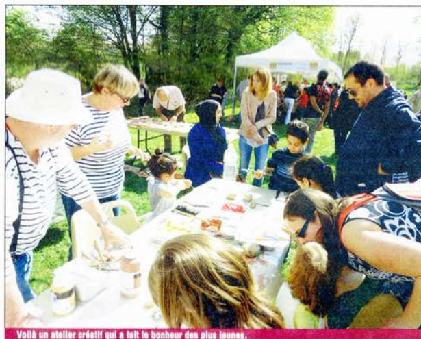
Voilà un atelier créatif qui a fait le bonheur des plus jeunes.