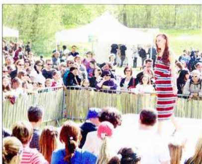
Le défilé de mode a créé son petit effet auprès de la foule.