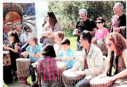
Parmi les animations, une initiation aux percussions avec Lokolé sound.

En fin de journée, l'association Huit et demi proposait la projection d'un film du Gabon "Le collier du Makoko", au Fellini.