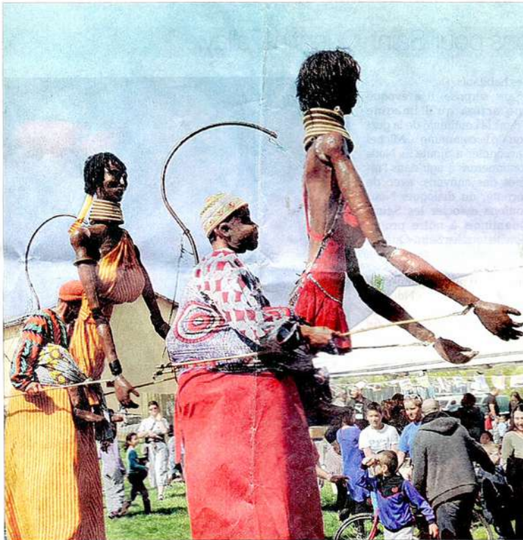
Difficile de les louper hier, dans le parc du Vellein. Le groupe "les Mamas" déambulait joyeusement parmi les visiteurs. De curieux personnages qui ne manquaient pas d'attirer l'attention des petits comme des grands !

H ier après-midi, le soleil était au rendez-vous pour la Fête du printemps. Rien d'étonnant : elle était placée sous le signe de l'Afrique !