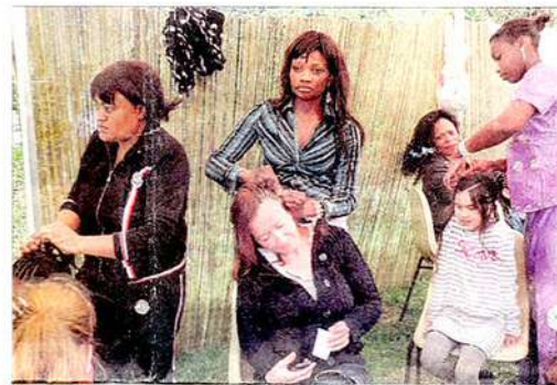
Hier, au Vellein, il était même possible de se faire faire des tresses.