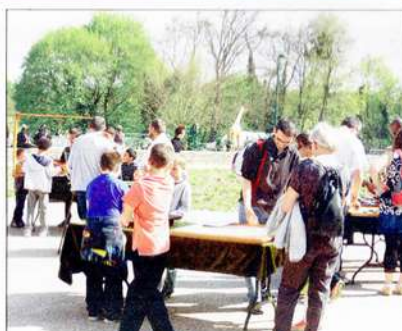
Les familles ont aussi pu découvrir des jeux typiques de l'Afrique.