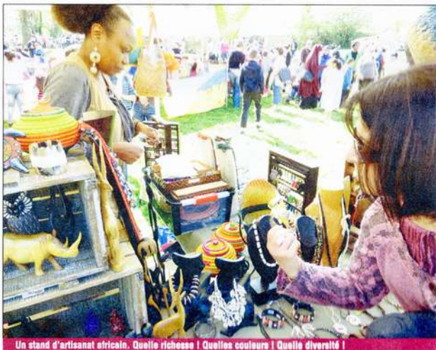
Un stand d'artisanat africain. Quelle richesse ! Quelles couleurs ! Quelle diversité !