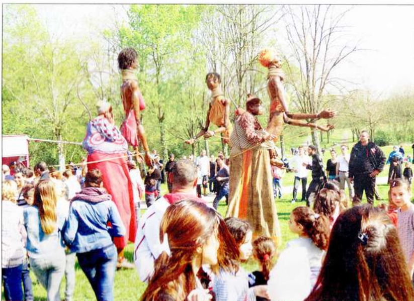
Les "Mamas" ont créé la surprise lors de cette fête qui s'est déroulée dimanche 6 avril, suscitant beaucoup de curiosité.